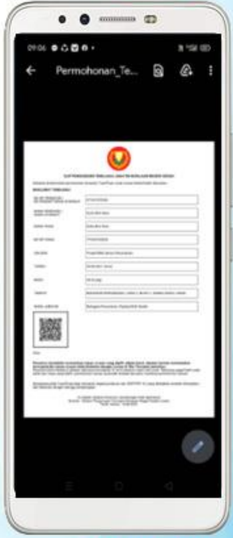
Terima Slip Janji Temu