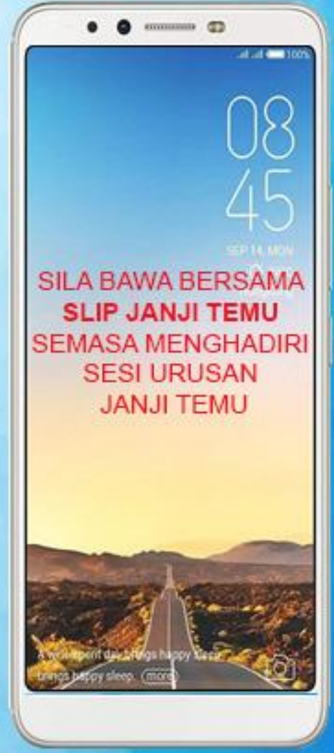
Bawa Slip Janji Temu semasa hadir Janji Temu